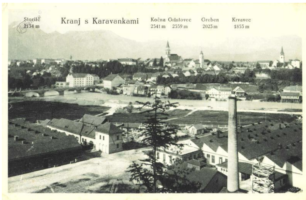
Slika 2: Kranjske tekstilne tovarne ob Savi: Jugočeška na desnem bregu, Intex na levem bregu, Tekstilindus in tovarna Franja Sirca v Stražišču.

plačano delovno silo. Upor se je razširil tudi v drugih gospodarskih branžah. Uprli so se gradbinci in delavci v lesnopredelovalni industriji. Upor se je pričel 11. avgusta 1936 pred Staro pošto, ko se je zbralo 2500 do 3000 upornih tekstilnih delavcev (Križnar, 1960: 344). Delavci so sprejeli resolucijo, ki je zahtevala: «... da naj do sklenitve kolektivne pogodbe, vsa podjetja ustavijo vsako znižanje plač in nadurna dela.» (Križnar, 1960, str. 344.) Stavkajoče so podprli delavci v Trziču, Škofji Loki, Mariboru in Preboldu in 1. septembra 1936 je v Sloveniji stavkalo že 8500 tekstilcev (Križnar, 1960: 345). Upor so zatrli z nasiljem, saj je oblast nad stavkajoče delavce poslala gojence policijske šole. Delno je bila stavka uspešna, saj so v podjetjih pričeli sprejemati kolektivne pogodbe. Tudi Franjo Sirc se je moral soočiti z delavskim uporom v svoji tovarni. Da bi pomiril delavce in zagotovil proizvodnjo, je bil prisiljen podpisati kolektivno pogodbo, ki je določala: «8 urni delavnik, mezdne tarife in enoten sistem le teh, merila za izplačevanja zaslužkov v primeru bolezni in ostalih zadržkov pri delu.» (Žontar, 2010: 296)